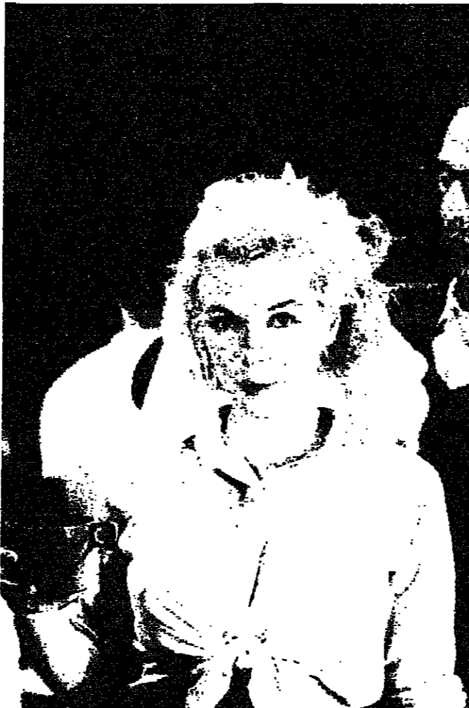
مارلين في شغل آخر قبل كاس الموت الانتحاري البشري